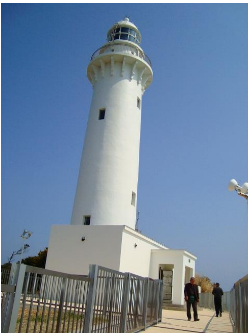
塩谷岬灯台（美空ひばりの「みだれ髪」 ゆかりの地に立つ。『喜びも悲しみも幾歳月』 （映画・木下恵介監督 1957年松竹作品）の 舞台にもなった）