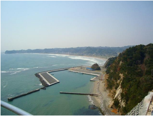
塩谷岬灯台から豊間地区を見下ろす（あたり一帯は、かつて夏の海水浴で賑わった有数の観光地でもある）