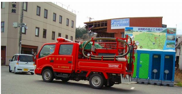
無人の駅前を防犯パトロールする消防車