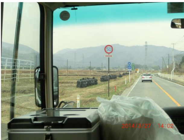
ロードサイド除染土壌