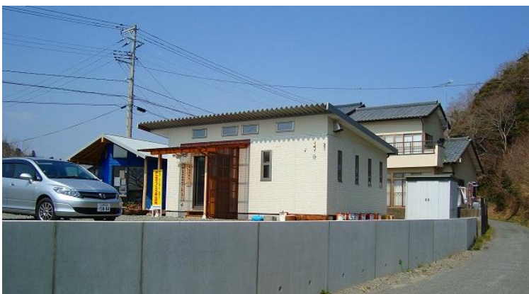
ふるさと豊間復興協議会事務局