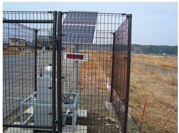
太陽光パネルで駆動する放射能測定器