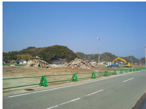
整地（撤去）の進む津波被災地